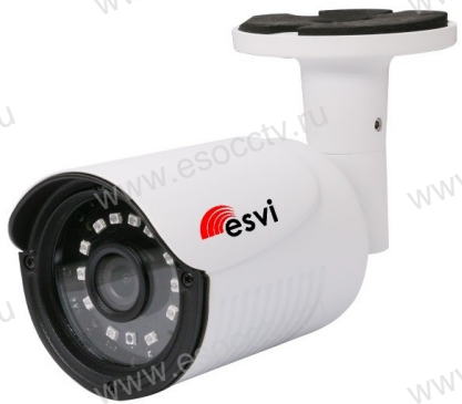
Руководство по быстрой настройке

Благодарим Вас за выбор нашего оборудования. Пожалуйста, перед использованием оборудования внимательно прочитайте данное руководство. Все программное обеспечение, необходимое для работы с оборудованием, Вы можете скачать с сайта esocctv.ru .