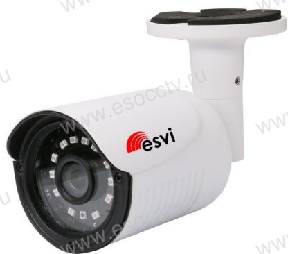
Руководство по быстрой настройке

Благодарим Вас за выбор нашего оборудования. Пожалуйста, перед использованием оборудования внимательно прочитайте данное руководство. Все программное обеспечение, необходимое для работы с оборудованием, Вы можете скачать с сайта esocctv.ru .